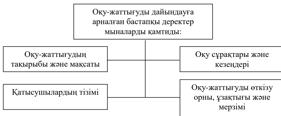
Сурет 2 – Оқу-жаттығуды дайындауға арналған бастапқы деректер

Оқу-әдістемелік құжаттарды әзірлеуге оқу-жаттығуды ұйымдастыру, өткізу туралы бастықтың бұйрығы міндетті түрде әзірлену қажет. Бұйрықта көрсетілген іс-шараларды жүзеге асыру үшін алдын ала оқу-жаттығуға дайындық күнтізбелік жоспар құрастырылу керек. Егер командалық-штабтық оқу-жаттығу жоспарлануда болса түсіндірме жазбасы бар оқу-жаттығу мәні деген құжат дайындалады. Оқу-жаттығулардың басқа түрлерінде бұл құжат қажет емес. Оқу-жаттығудың тапсырмасы деген құжат нақты жаттығуға дайындалуға арналған құжат болып табылады, өйткені бұнда жеке және жалпы жағдай анықталу қажет. Оқу-жаттығудың жоспары нақты оқу-жаттығуды өткізуге қажетті құжат, осы құжатта тақырыбы, оқу мақсаттары, кезеңдерді, оқу сұрақтары, қатысушылардың құрамы, ұзақтығы, уақыты және өткізу орны, жағдайдың сипаттамасы (берілетін тапсырмалар), қатысушылардың әрекеттері анықталып көрсетілу керек.