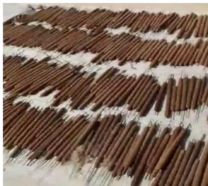
Рисунок 2 – Созревание початков рогоза на открытом воздухе

Поэтому перед проведением сушки необходимо отделить пух рогоза от стебля. Трудоемкость отделения пуха от стебля зависит от степени созревания семян. При полном созревании семян пух самопроизвольно отделяется от початка. При сборе еще не созревших початков, необходимо использовать специальный отделитель или обеспечить дозревание початков (рис. 2).