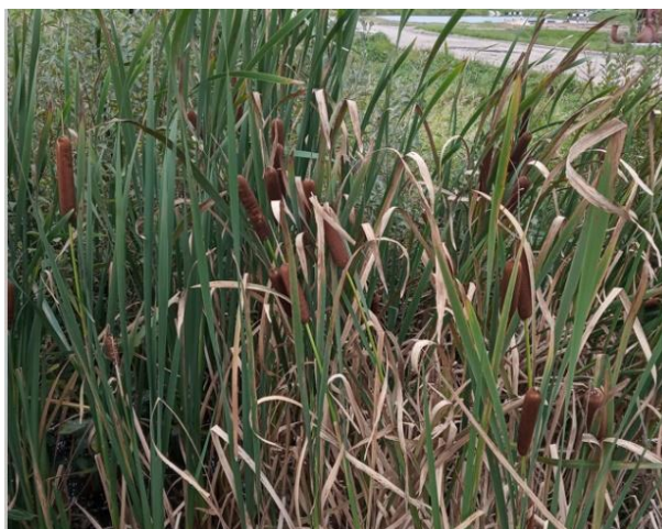
Рисунок 1 – Заросли рогоза в Борисовском районе Минской области

В связи с отсутствием на сегодняшний день специализированных сельскохозяйственных машин и механизмов пригодных для выращивания рогоза, первые посадки можно осуществлять вручную, заглубляя корневища в землю на 15 см. В последующие годы он будет интенсивно разрастаться вегетативно и дополнительных посадок не потребуется. Учитывая высокую морозостойкость рогоза, отпадает необходимость в проведении дополнительных операций по утеплению и предохранению его корневищ. При планируемом ежегодном разливе пяти тонн нефти (НП) для ЛАРН будет достаточно при однократном применении 500 кг пуха рогоза (для механизированных работ приняли уменьшенную сорбционную емкость в пределах 10 кг/кг), тогда как при 5-ти кратной регенерации необходимо только 100 кг сорбента на основе пуха рогоза. При посеве рогоза широколистного, урожайность сырой надземной фитомассы которого достигает – 115 т/га [8], собрать початки рогоза можно в количестве 10 т/га, тогда 100 кг пуха рогоза можно собрать с площади 10000 м 2 (1 га).